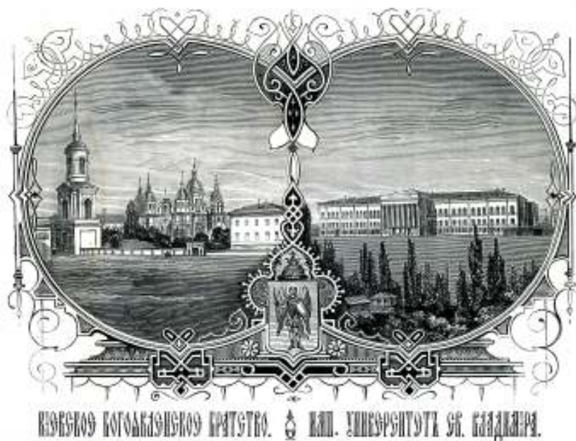
Гравюра из книги М. Максимовича (первого ректора Киевского университета Св. Владимира) «Письма о Киеве...», 1871 г.

В итоге, стремление правительства к централизации и к полному подчинению Украины привело в 1835 году к упразднению в Киеве Магдебургского права и отмене Литовского статута. Киевский герб с изображением архангела Михаила и имущество Магистрата были проданы, а городская артиллерия передана в Петербургский артиллерийский музей. Городская дума, занявшая место старого магистрата, была перенесена с Подола на новое место.