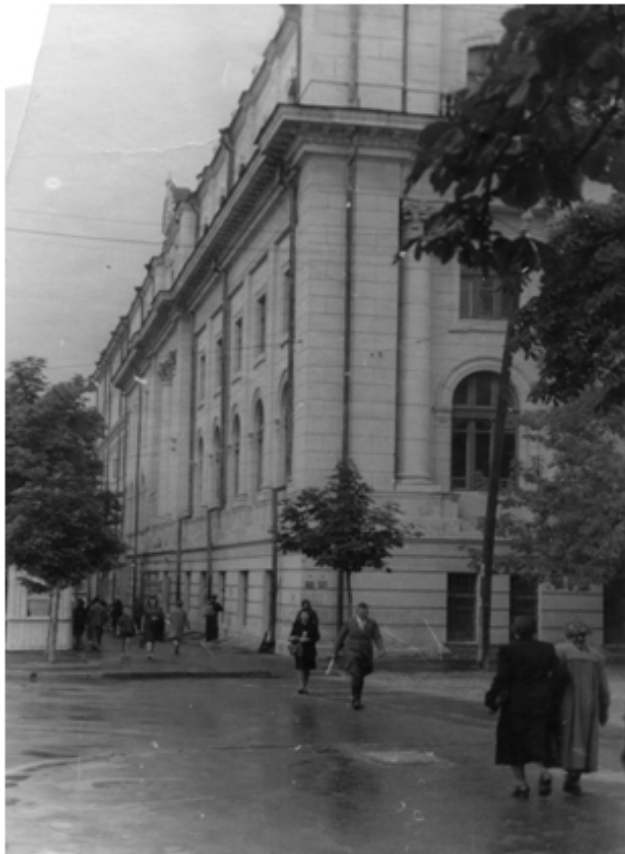
Корпус Київського державного педагогічного інституту імені О. М. Горького (з боку вул. І. Франка наприкінці 50-х років) На першому поверсі розташована бібліотека.