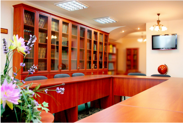
Читальний зал рідкісних видань та рукописів Наукової бібліотеки Національного педагогічного університету імені М. П. Драгоманова

партнером Української бібліотечної асоціації. Тісна співпраця пов'язує нашу бібліотеку з бібліотеками Білорусії, Латвії, Німеччини, Польщі, Росії, в тому числі в рамках підписаних угод.