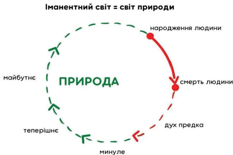
Схема 1. Темпоральна парадигма міфологічного типу світогляду

ли все, що відбувається в теперішньому, вбачається таким, що вже колись десь було аналогічним у минулому, досвід померлих обов'язково зберігає свою актуальність для усіх прийдешніх поколінь. Іншими словами, в темпоральній парадигмі міфологічного світогляду умови соціального буття, його основні координати і цінності залишаються практично незмінними від покоління до покоління. Тому померлі представники роду вбачаються носіями цього безцінного досвіду, і саме тому до них є сенс звертатися при потребі [14; 41]. Отже, фізична смерть за темпоральності міфологічного типу світогляду є переходом в інший тип іманентності — у світ духів, який взаємодіє зі світом живих, але вже опосередковано. Наявний тип темпоральності ми можемо представити у вигляді наступної схеми: