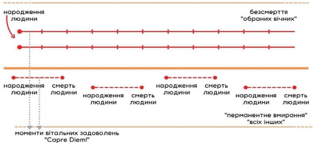
Схема 4. Темпоральна парадигма трансгуманістичного типу світогляду

На представленій схемі ми можемо бачити сегрегацію людей, розділення їх на два принципово різні типи. Можливо сказати, що «рукотворних безсмертних» ми можемо назвати «техногенними богами», зосередженими на безсмерті, а «помираючих у моменті» людьми іншого сорту. Помирати стане соромно, непрестижно; фізична смерть може стати індикатором соціальної невдалості. Однак і для перших, і для других час як транзит модусів «минуле — теперішнє — майбутнє» перестане існувати. Соціальний час «схлопнеться» втратить свій вектор, описана нами ситуація вбачається нами як соціальність, в якій фактично «нічого не відбувається».