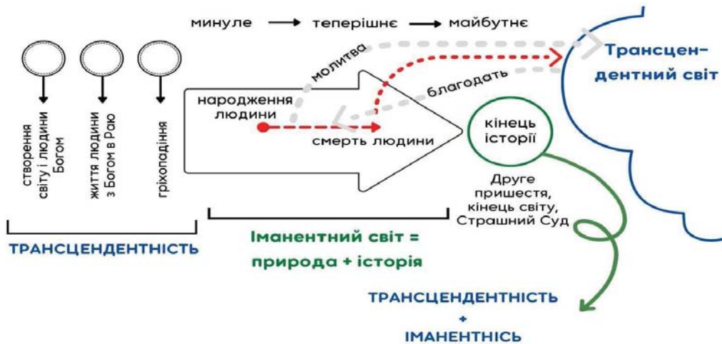
Схема 2. Темпоральна парадигма релігійного типу світогляду

Описану нами темпоральність у релігійній світоглядній парадигмі ми можемо зобразити у вигляді схеми наступним чином: