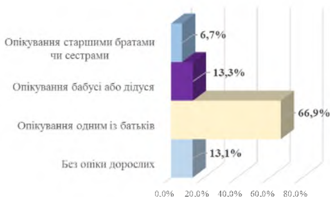
Рисунок 2: Стан організації опіки над дітьми трудових мігрантів

Picture 1: The state of one/both parents being foreign workers